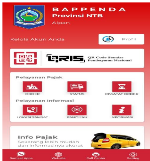
Gambar 3. Gambar aplikasi e-samsat delivery

Berikut adalah langkah awal melaselaikukan pemesanan pembayaran pajak kendaraan bermotor .informasi yang harus diisi antara lain nomor polisi ,nama pemilik,merek,warna,tahun di buat,masalaku notis,dan masalaku STNK.selain itu pada menu order juga terdapat informasi mengenai rincian pembayaran yang akan di gunakan serta alamat pemesanan,tanggal dan jam pengantaran (jam kerja)setelah itu wajib pajak dapat membuat pesanan