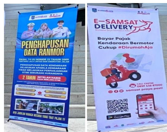
Gambar 2.Banner sosialisasi samsat