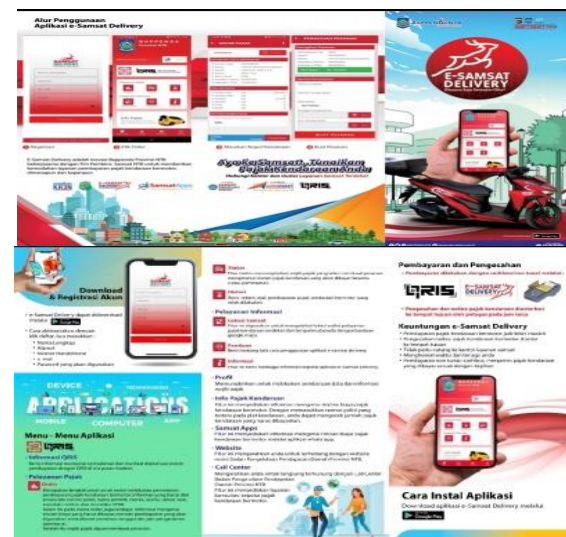
Gambar 1. Gambar brosur e-samsat delivery

Hasil wawancara kepada oprator samsat delivery dan observasi yang dilakukan, masih tahap selanjutnya adalah mempersiapkan alat dan bahan sosialisasi. Menyiapkan brosur sebanyak 100 lembar Brosur yang bersumber dari UPTB UPPD PRAYA. ada dua benner yang yang disediakan yaitu benner samsat delivery dan benner penghapusan data ranmor dan aplikasi yang ingin di sosialisasikan ke masyarakat yaitu aplikasi e-samsat delivery.